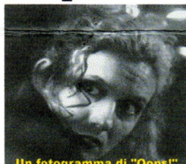
Un fotogramma di "Oops!"

Presso FILMSTUDIO , piazza Diaz, 46r in Savona, verrà presentata una selezione di opere scelte a FILMVIDEO 2000.