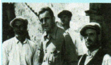
"In nome della legge" di Pietro Germi

di Pietro Germi con Massimo Girotti, Jane Salinas