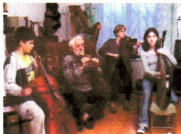
Il mondo musicale di nonno Batista

dei film e video prodotti dai soci del Super8 & Video Club Merano negli anni 1999/2000. Alcune di queste opere hanno già ottenuto consensi a livello nazionale ed internazionale.