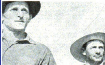
"Scanu Boa" di Renato Dall'Ara

In programma: "SCANO BOA" (1954) di Renato Dall'Ara, "MARCO DEL MARE" (1956) di Piero Livi, "NOZZE D'ARGENTO" (1956) di Massimo Sani-Ezio Pecora, "L'ANIMA DELLE COSE" (1959) di Tito Spini, "UN UOMO SBAGLIATO" (1967) di Nedo Zanutti, "UOMINI" (1988) di Rolf Mandolesi, "DOPPIO-PETTO" (1997) di Giuseppe Ferlito.