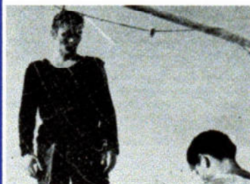
"Marco del mare" di Piero Livi

Una selezione di opere a cura di Paolo Micalizzi di Fedicinema, rappresentative degli "Autori Fedic di ieri e di oggi".