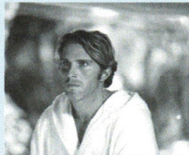
Una scena del film "Uno spruzzo di pulp"

3° Premio : "MUSIC FOR AN OWL" di Ties Poeth- Breda-Olanda (Premio Fedic);