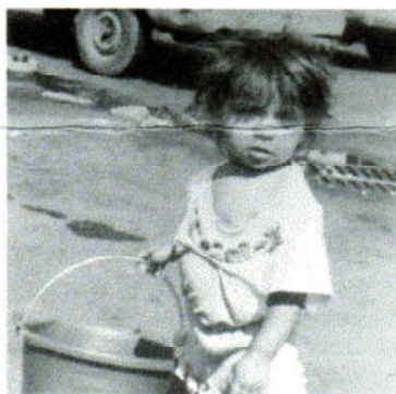
Una inquadratura del film "Vivere contro" di Mario Carra