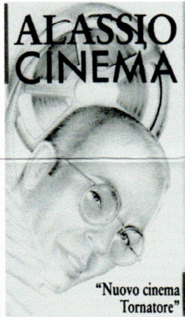
"Omaggio a Tornatore" di Beppe Rizzo Cineclub "W.Barinetti" Alassio