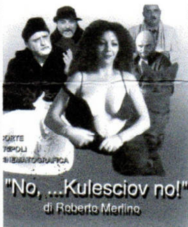
La locandina del film di Roberto Merlino Cineclub Corte Tripoli Cinematografica La Spezia