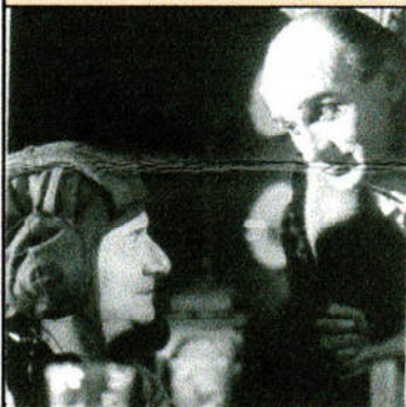
Una inquadratura del film "Il catturatore" di Stefano Besson del Cineclub Fedic Roma