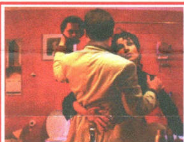
Un fotogramma del film "Toilette" di Massimo Cappelli che ha vinto l'edizione 1999 del Fano Film Festival

5) Entro tale data ciascun partecipante dovrà far pervenire allo stesso indirizzo, a mezzo vaglia postale intestato come sopra e pagabile nell'Ufficio di Bellocchi di Fano, la somma di £.35.000 per ogni opera presentata, quale parziale contributo per spese di segreteria ed organizzazione.